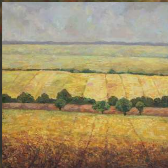
Złote pola, 60 x 60

ELEKTROMONTAŻ RZESZÓW S.A. PODKARPACKIE TOWARZYSTWO ZACHĘTY SZTUK PIĘKNYCH