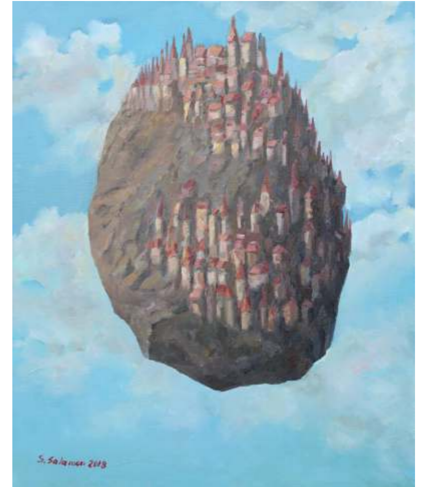
Kompozycja z wieżami, 60 x 50