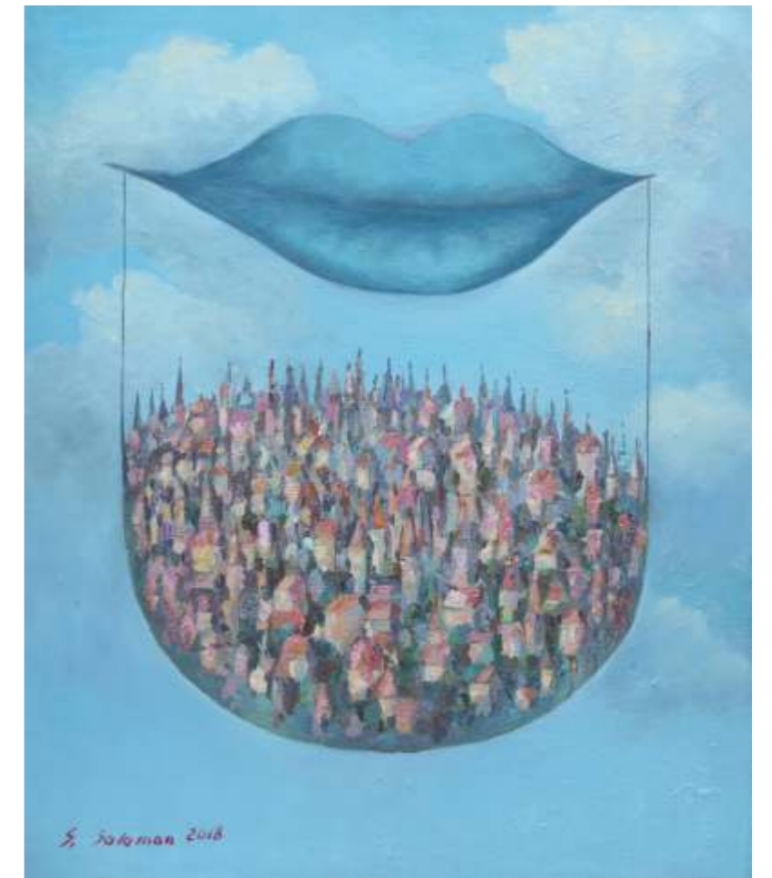
Pogodny dzień, 60 x 50