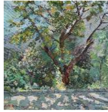
W ogrodzie, 60 x 60

Nic, co by mogło się przydać nie znajdziemy w tej krainie Sabiny Salamon-Konieczny. Mimo, iż większość jej obrazów przedstawia rozległy pejzaż z ogromem nieba aż po odległy horyzont, krajobraz za każdym razem inny, jest to jednak widok z tego samego okna. Fragment, na który padnie wzrok przybliży się, powiększa - widać łąkę gdzie na grubej oplecionej powojem łodydze wyrasta miasto, w innym miejscu skaliste zbocze z kamienną bramą do nikąd, tam znowu w dolinie nad rzeką rozpina nad spokojnymi wsiami swoją pajęczynę olbrzymi pająk. W końcu nie wiadomo czy to okno jest czarodziejskie, czy może taką niezwykłą władzę ma Sabina.