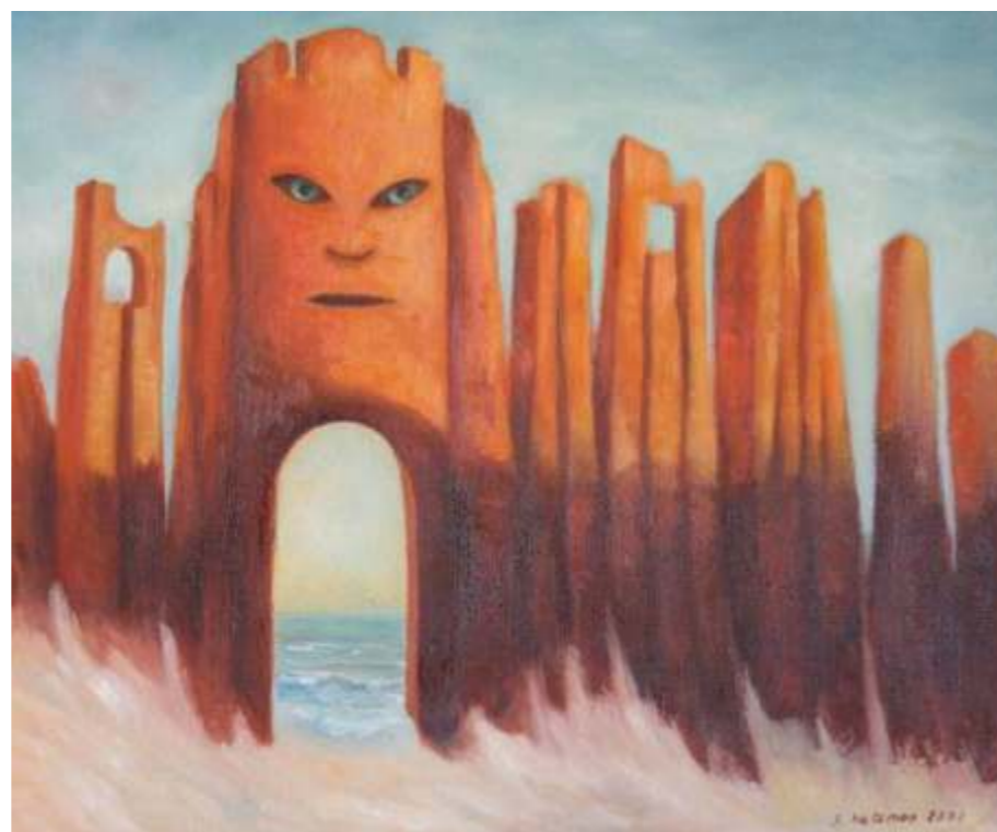
Nadmorski pejzaż, 50 x 60