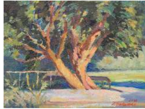
Wierzba, 30 x 40