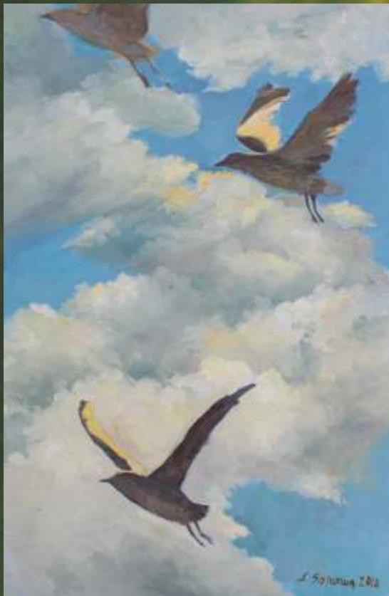
Kompozycja, 60 x 45